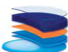
Специальный слой SR Booster

В производстве покрытия Crizal Forte используется специальный дополнительный слой, который называется SR Booster™. Он находится между упрочняющим и просветляющими слоями, что позволяет сделать постепенный переход между мягким органическим материалом линзы и твердыми минеральными слоями антирефлексного покрытия. В результате мы получаем непревзойденную устойчивость покрытия к царапинам и внешним воздействиям, что значительно увеличивает продолжительность использования линз.